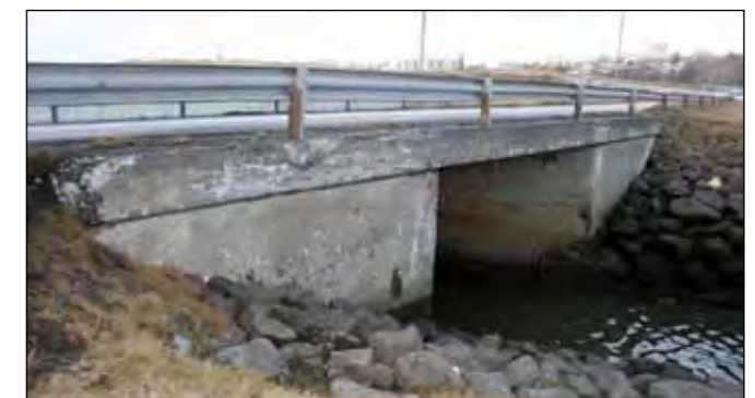
Hér er auglýst útboð steypuviðgerða á brú yfir Kópavogslæk.