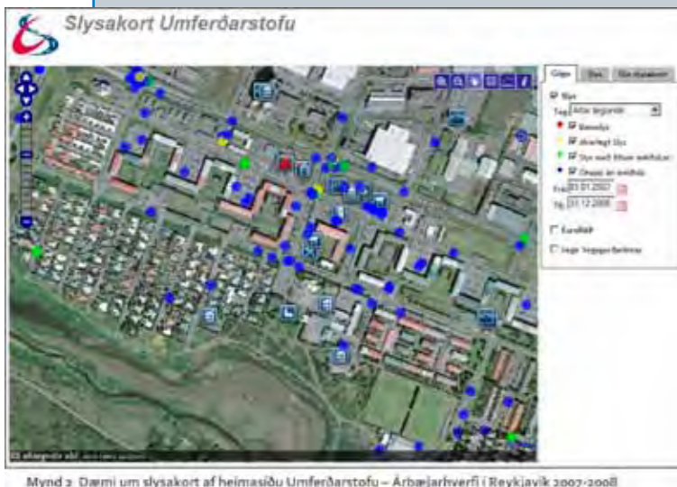
Mynd 2: Dæmi um slysakort af heimasíðu Umferðarstofu – Árbæjarhverfi í Reykjavík 2007-2008

Árið 2004 var sérstakur stýrihópur skipaður sem m.a. var falið að móta heildarstefnu í umferðaröryggismálum og stilla saman krafta stofnana og annarra aðila sem fara með umferðaröryggismál í landinu. Með áætluninni eru sett fram markmið um aukið umferðaröryggi til ársins