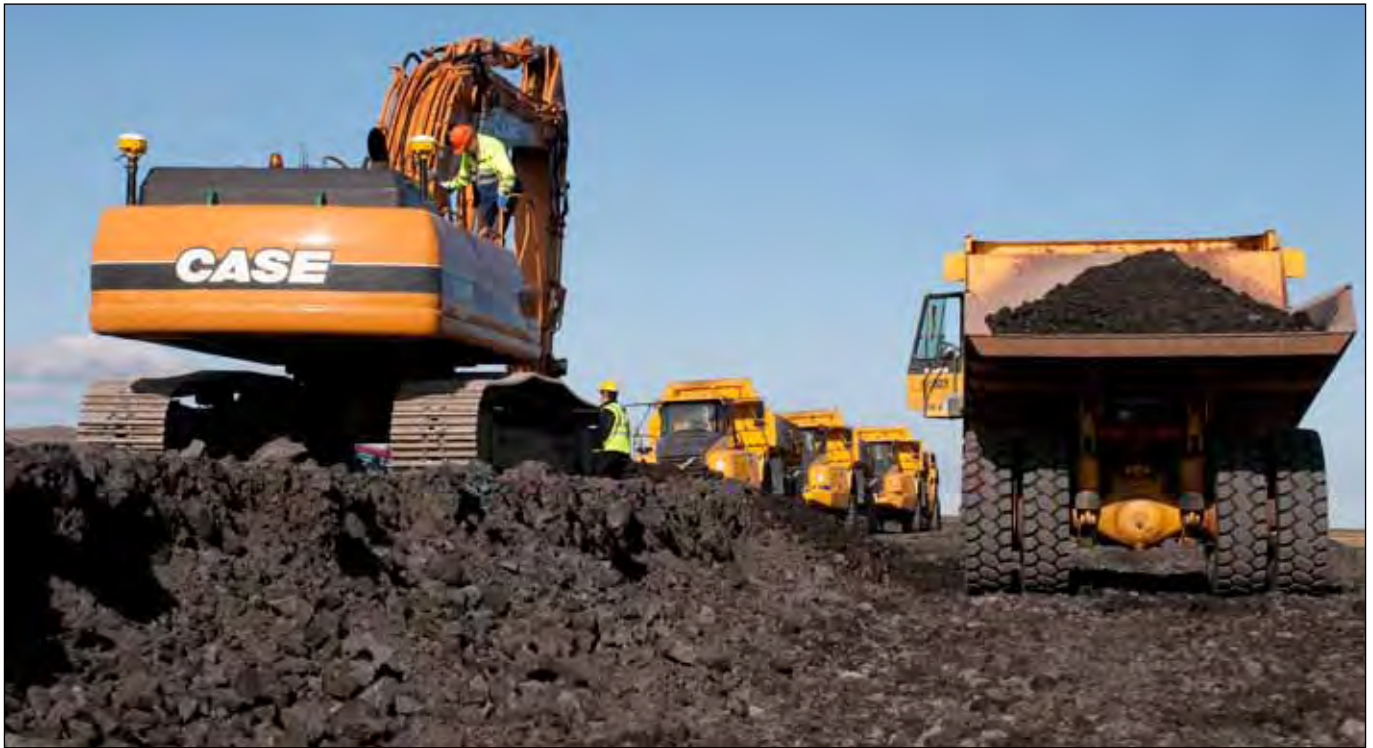
Suðurlandsvegur. Yfirhæð fjarlægð.