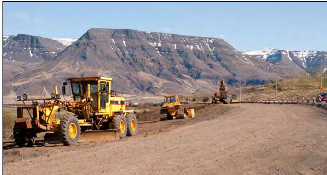
Framkvæmdir við breikkun Hringvegur (1), Vesturlandsvegur, sunnan Þingvallavegar eru nú í gangi.